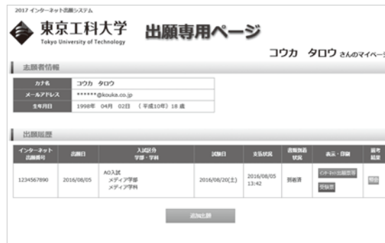
入学検定料支払い後、「インターネット出願サイト」から「マイページ」にアクセスすることができます。