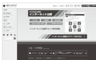
本学Webサイトトップページから「インターネット出願サイト」にアクセス