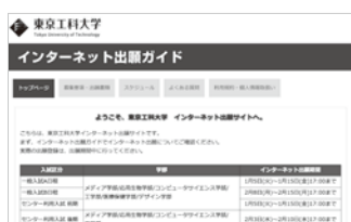
東京工科大学「インターネット出願サイト」このページから出願登録ができます。