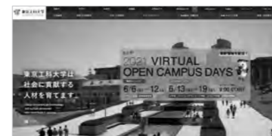
本学Webサイトトップページから「インターネット出願サイト」にアクセス

◎「マイページ」は、入学検定料支払い後自動的に作成される、あなたの「出願専用ページ」です。