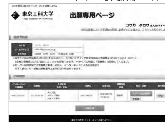
「マイページ」(出願専用ページ)イメージ

入学検定料支払い後、「インターネット出願サイト」の「マイページ」ボタンをクリックし「氏名(カナ)」「メールアドレス」「生年月日」を入力すると、「マイページ」にアクセスすることができます。