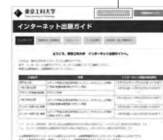
東京工科大学「インターネット出願サイト」。このページから出願登録ができます。